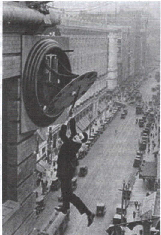
Harold Lloyd, Safety last , 1923.