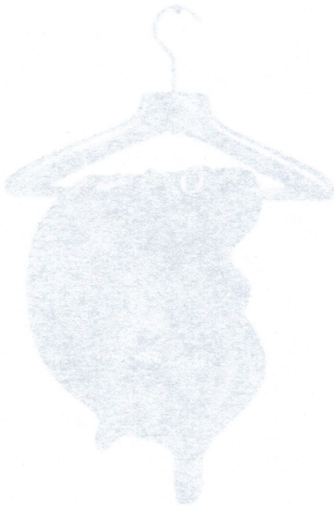
Matière mise posée sur un cintre, 1970.