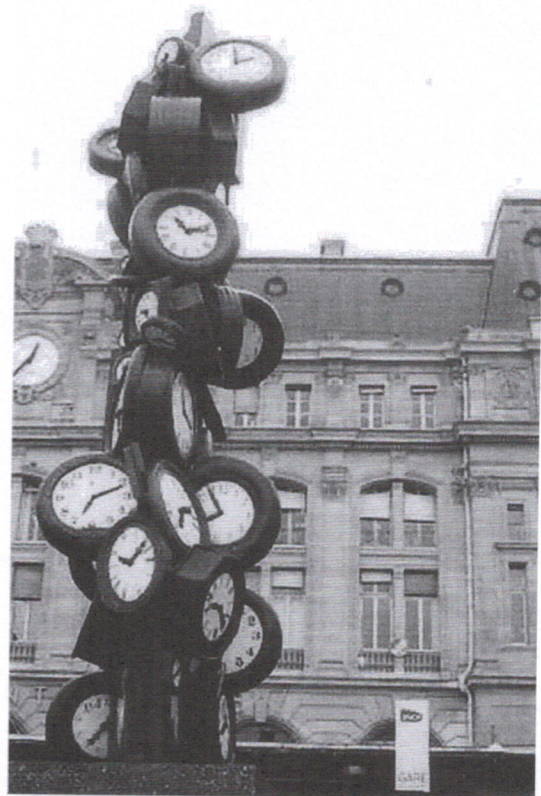
Lefèvre Daniel, L'horloge de la gare Saint-Lazare , 2011.