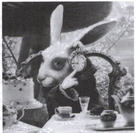
Lewis Carroll, Le lapin d'Alice au pays des merveilles (1869), Disney, 2010.

Le rôle des services publics proposés par l'état, au sein d'un cadre de services de qualité, est devenu un enjeu politique crucial. De nouveaux efforts sont en cours pour améliorer la qualité du travail du secteur public et de promouvoir de nouvelles formes de participation et de