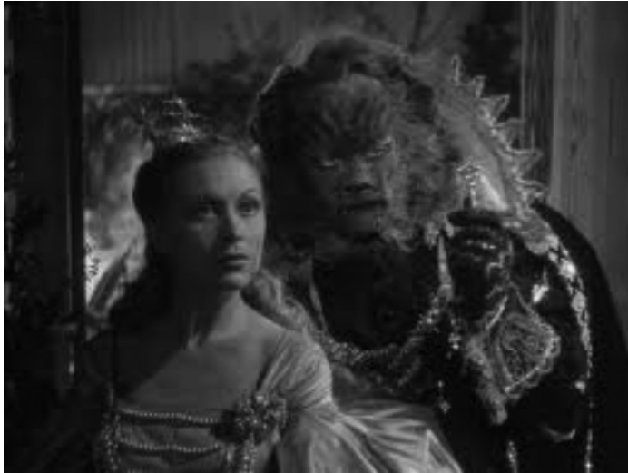
Image du film réalisé en 1945 par Jean Cocteau.

L'une des versions les plus anciennes de ce conte est sans doute celle d'Apulée, qui date du II e siècle.